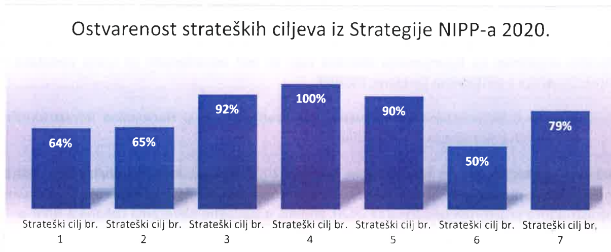
Grafički prikaz 1: Ispunjenje strateških ciljeva u postocima 5

Vijeće NIPP-a podnijelo je u IV. kvartalu 2021. godine, a u skladu s točkom III. Odluke o donošenju Strategije i Strateškog plana, na prihvaćanje Vladi Republike Hrvatske navedeno izvješće. Vlada Republike Hrvatske je početkom siječnja 2022. g., na svojoj 94. sjednici, prihvatila Izvješće.